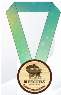
Figura 1 – Verso de medalha de premiação da III FECITBA.

Os resultados deve ser a maior seção do seu relatório, afinal, é ele que vai responder suas questões de investigação e dizer se suas hipóteses estavam certas ou erradas. Abaixo temos dois exemplos de como inserir figuras com a legenda e fonte. As letras dessa legenda e fonte são tamanho 10 e a obra citada na fonte deverá vir nas referências do final do relatório também.